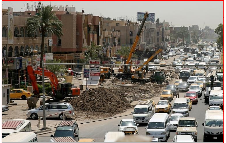
Photo prise le 5 août 2018 des embouteillages dans une rue de Bagdad ( https://www.challenges.fr/societe/a-bagdad-des-rues-retrouvent-vie-avec-la-leeve-de-barrages-de-beton_605937t )