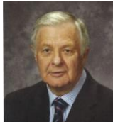
Pères Gilles 12 & 13 août